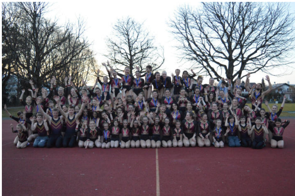
Vereinswettkampf Thun, 8. März 2025