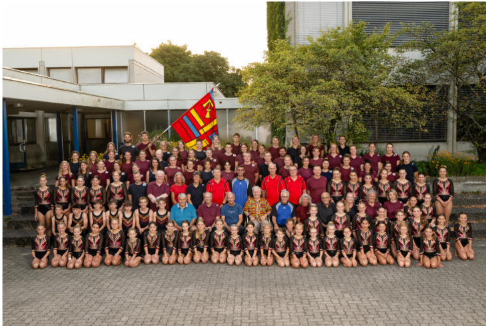
Jubiläumsapéro mit Fototermin, 15. August 2025