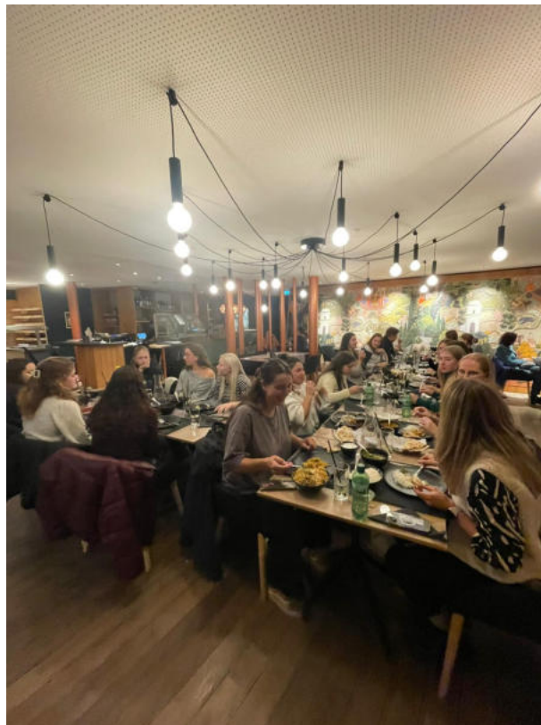
Spielnachmittag, 22. November 2025