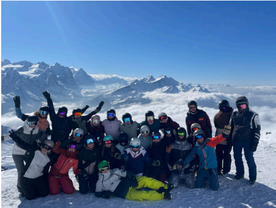
Skiweekend Hasliberg, 1. / 2. März 2025