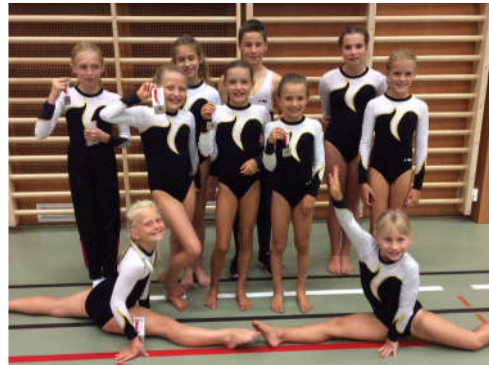
Turnerinnen K2 + Jason K4