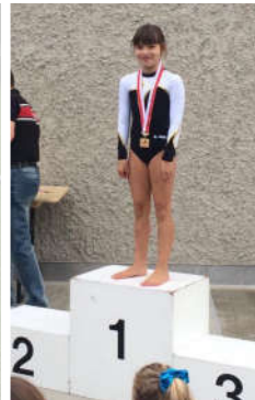
Sanna Berger Platz 1